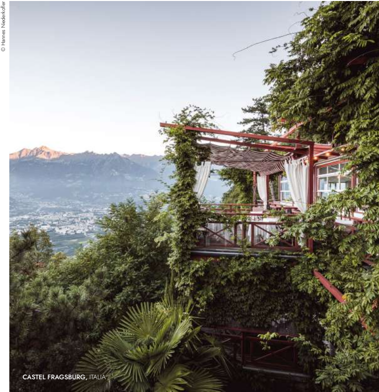
CASTEL FRAGSBURG, ITALIA

Questi impegni riflettono un profondo desiderio di contribuire – attraverso l'arte dell'ospitalità e della cucina e guidati da una passione condivisa per la bellezza e il gusto – a costruire un mondo più rispettoso, solidale e sostenibile, in armonia con il pianeta.