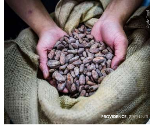
PROVIDENCE, STATI UNITI