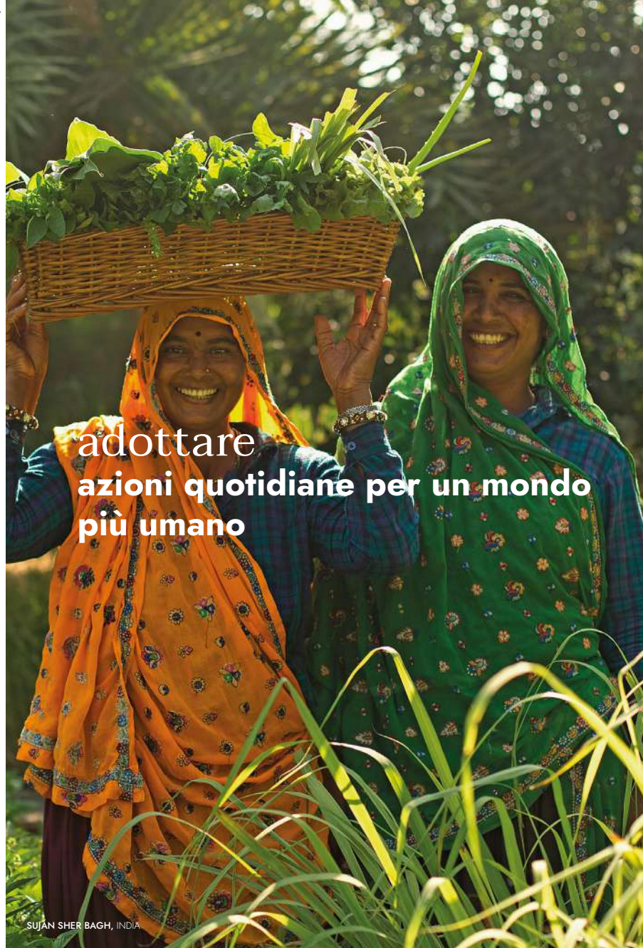
SUJAN SHER BAGH, INDIA

adottare azioni quotidiane per un mondo più umano