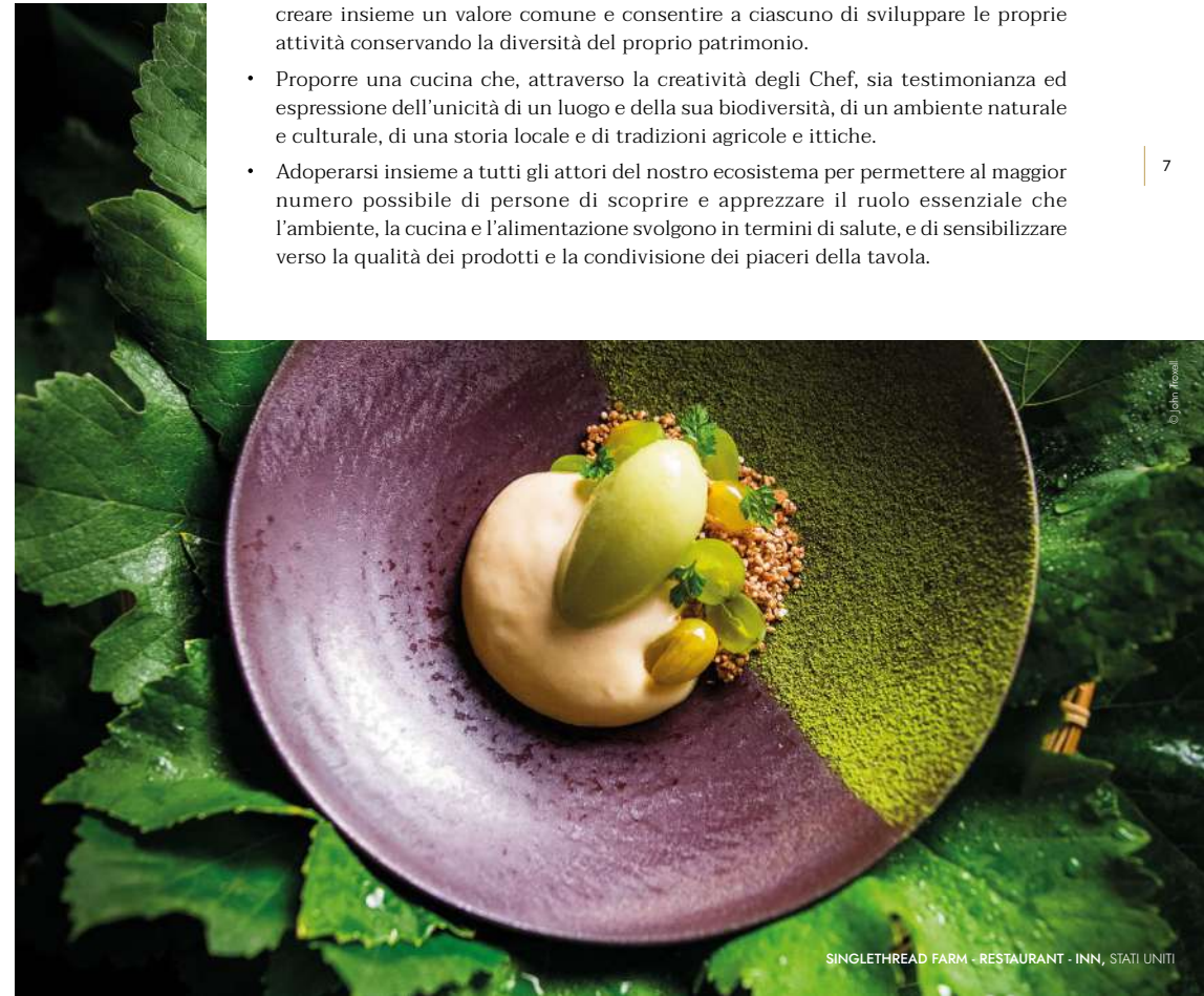
SINGLETHREAD FARM - RESTAURANT - INN, STATI UNITI