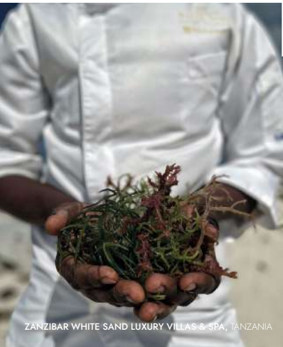
ZANZIBAR WHITE SAND LUXURY VILLAS & SPA, TANZANIA

Fondata nel 1954, Relais & Châteaux è un'associazione che riunisce hotel e ristoranti d'eccezione in tutto il mondo, per la maggior parte a conduzione familiare, gestiti da imprenditori indipendenti: donne e uomini, spesso famiglie, che si impegnano a far vivere la propria cultura locale e a condividere la propria passione per la bellezza e il gusto.