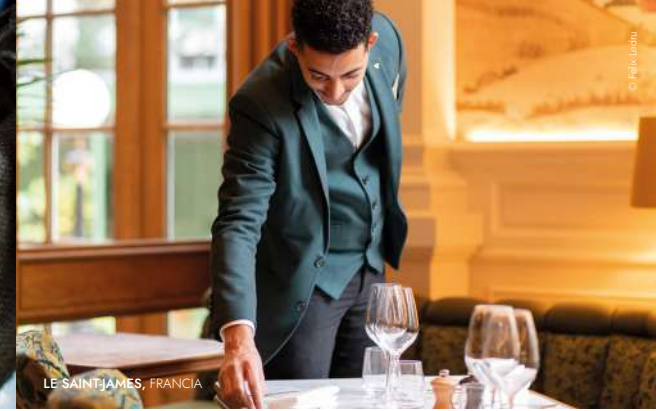
LE SAINT-JAMES, FRANCIA